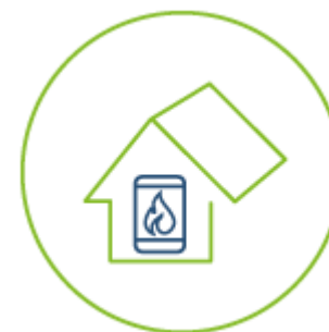
kotly na biomasu