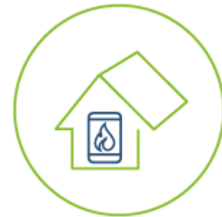
kotly na biomasu