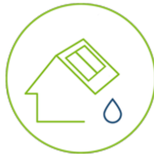
slnéčné tepelné kolektory